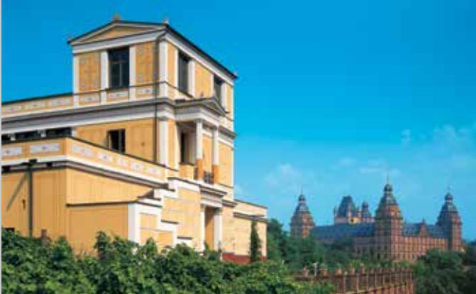
Pompejanum mit Schloss Johannisburg