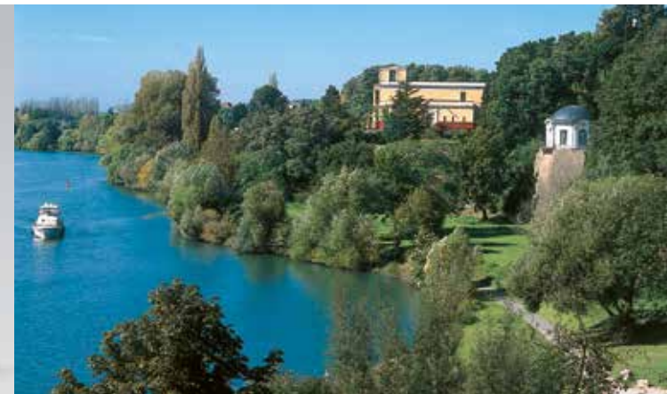
Blick von Schloss Johannisburg auf die Parkanlage

Auf der folgenden kleinen Anhöhe gelangt man dann zu dem 1782 von Herigoyen entworfenen klassizistischen »Frühstückstempel«. Hinter diesem liegt der letzte noch erhaltene Teil des ehemaligen Stadtgrabens, der in den 1780er Jahren von Friedrich Ludwig Sckell landschaftlich gestaltet wurde.