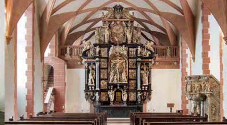
Altar der Schlosskirche