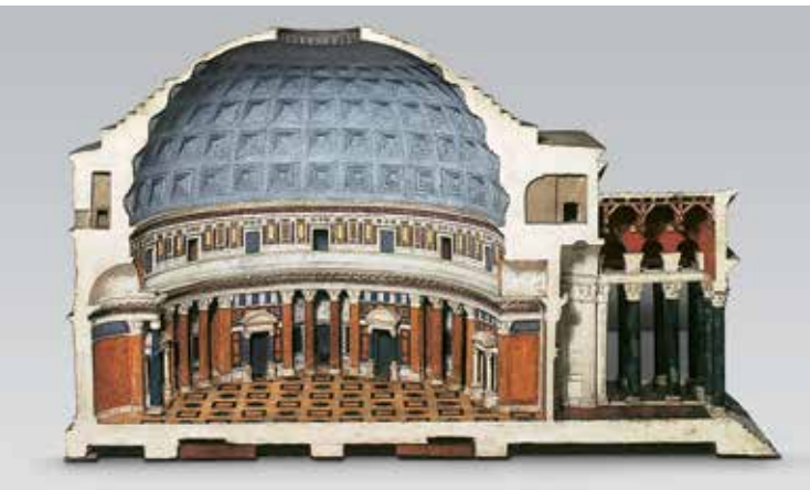
Das Pantheon aus der Korkmodellsammlung

Aschaffenburg, das eindrucksvolle Kunstwerke von mittelalterlichen Skulpturen über wertvolle Möbel und Keramik bis zu Gemälden von Christian Schad zeigt. Im Anschluss an den Schlossbesuch empfiehlt sich ein Spaziergang durch den kleinen, aber abwechslungsreichen Schlossgarten zum Pompejanum. Zunächst bietet die von einer Balustrade eingefasste Mainterrasse einen weiten Ausblick ins Maintal. Der weitere Weg führt hinunter zu einem reizvollen Laubengang, der sich über einem erhaltenen Abschnitt der mittelalterlichen Stadtmauer erstreckt.