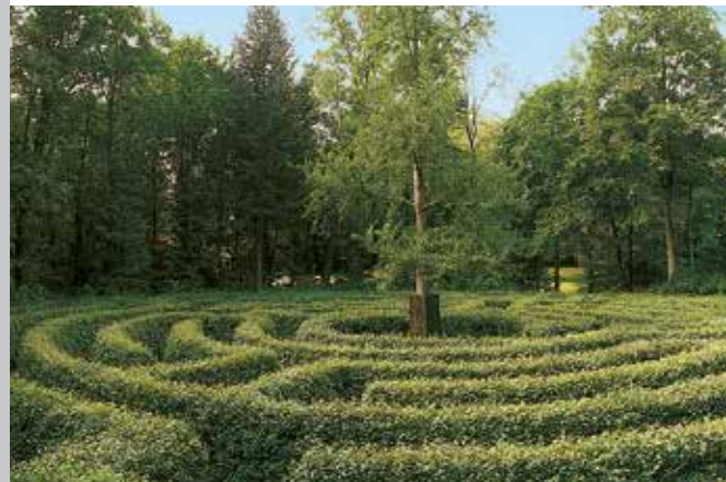
Der Irrgarten im Park

Ab 1775 entstand der Park Schönbusch südwestlich von Aschaffenburg, der damaligen zweiten Residenz des Kurerzbischofs von Mainz. Friedrich Carl von Erthal ließ den bisherigen Wildpark nach Ideen seines Ministers Wilhelm von Sickingen als einen der ersten Gärten in Süddeutschland im neuen englischen Landschaftsstil anlegen. Die verschiedenen Bauwerke entwarf der Hofarchitekt Emanuel Joseph von Herigoyen. Der um 1785 berufene Schwetzingener Hofgärtner Friedrich Ludwig Sckell, der bedeutendste Gartenkünstler der Goethezeit, verlieh dem Landschaftsgarten Schönbusch schließlich seine klassische Form. Verstreut im Park liegen, als Staffagearchitekturen eingebettet in reizvolle Landschaftsbilder: Rote Brücke, Philosophenhaus, Freundschaftstempel, Hirtenhäuser