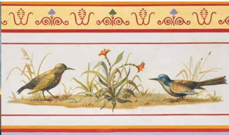
Detail der rekonstruierten Wandmalerei im sog. Sacrarium

Im Zweiten Weltkrieg schwer beschädigt, konnte das Pompejanum seit 1960 in mehreren Phasen wieder restauriert und vervollständigt werden. Seit 1994 sind hier nun zusätzlich originale römische Kunstwerke aus den Beständen der Staatlichen Antikensammlungen und der Glyptothek in München zu sehen. Neben römischen Marmorskulpturen, Kleinbronzen und Gläsern zählen zwei Götterthronen aus Marmor zu den wertvollsten Ausstellungsstücken. Zusätzlich finden jährlich wechselnde Sonderausstellungen zu archäologischen Themen statt. Um das Pompejanum erstreckt sich eine kleine, ebenfalls Mitte des 19. Jahrhunderts angelegte Gartenpartie. Hier sollte eine »mediterrane Ideallandschaft« entstehen. Wärmeliebende Gehölze wie Feigen, Araucarien, Mandelbäume, Wein, Säuleneppeln und Kiefern prägen zum Großteil noch heute das Bild dieses südländisch anmutenden Gartens.