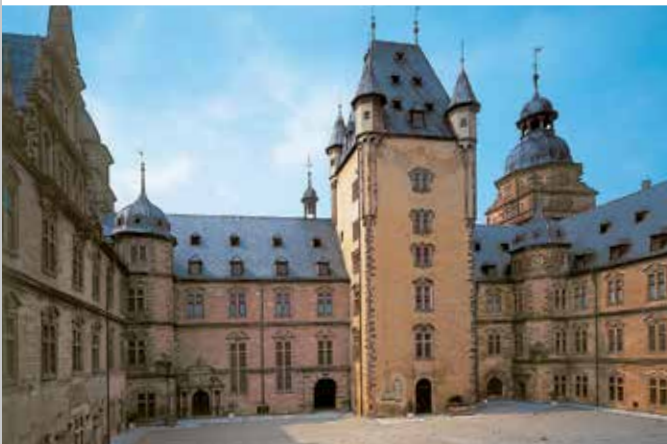
Schloss Johannisburg mit mittelalterlichem Bergfried

und Portalskulpturen von Hans Juncker (frühes 17. Jahrhundert), die Paramentenkammer mit Gewändern aus dem ehemaligen Mainzer Domschatz sowie die fürstlichen Wohnräume mit den erhaltenen klassizistischen Möbeln und Ausstattungsstücken. Eine sehenswerte Besonderheit ist die weltweit größte Sammlung von aus Kork angefertigten Architekturmodellen. Diese verblüffend detailgenauen Nachbildungen, die der Hofkonditor Carl May und sein Sohn Georg ab 1792 schufen, geben die berühmtesten Ruinen Roms wieder. Seit 1996 werden die restaurierten Modelle in neu gestalteten Räumen gezeigt.