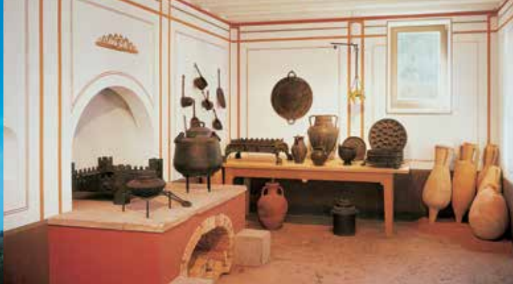
Küche mit originalen Amphoren

Im Zweiten Weltkrieg schwer beschädigt, konnte das Pompejanum seit 1960 in mehreren Phasen wieder restauriert und vervollständigt werden. Seit 1994 sind hier nun zusätzlich originale römische Kunstwerke aus den Beständen der Staatlichen Antikensammlungen und der Glyptothek in München zu sehen. Neben römischen Marmorskulpturen, Kleinbronzen und Gläsern zählen zwei Götterthronen aus Marmor zu den wertvollsten Ausstellungsstücken. Zusätzlich finden jährlich wechselnde Sonderausstellungen zu archäologischen Themen statt. Um das Pompejanum erstreckt sich eine kleine, ebenfalls Mitte des 19. Jahrhunderts angelegte Gartenpartie. Hier sollte eine »mediterrane Ideallandschaft« entstehen. Wärmeliebende Gehölze wie Feigen, Araucarien, Mandelbäume, Wein, Säuleneppeln und Kiefern prägen zum Großteil noch heute das Bild dieses südländisch anmutenden Gartens.