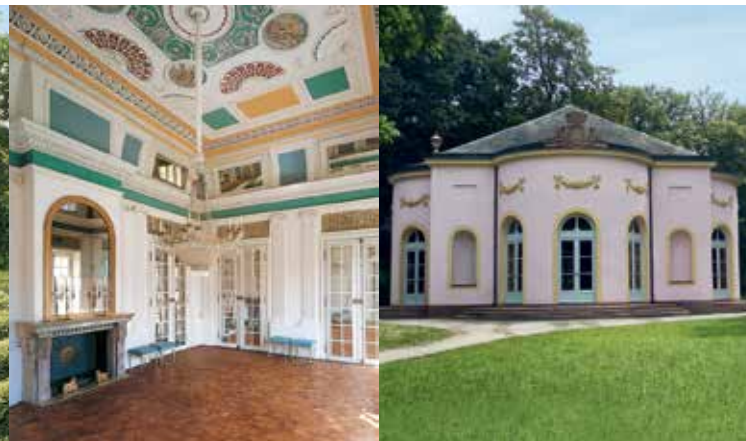
Saal im Schloss (li.); Speisesaal im Schlosspark (re.)

und Dörfchen, Speisesaal und Wirtschaftsgebäude sowie die künstlich aufgeschütteten »Berge« mit Aussichtsturm und Teufelsbrücke. Das klassizistische Gartenschloss, erbaut 1778 bis 1782 nach Plänen des Architekten Emanuel Joseph von Herigoyen, ist durch eine Blickachse mit dem Stadtschloss Johannisburg verbunden. Seine mit Mobiliar im Stil Louis-seize eingerichteten zehn Schauräume bieten ein anschauliches Beispiel fürstlicher Wohnkultur am Ende des 18. Jahrhunderts. Im Küchenbau des Parks befindet sich ein Besucherzentrum, das an den Wochenenden und an Feiertagen von April bis September geöffnet ist. Hier kann der Spaziergänger sich in einer Ausstellung über die facettenreiche Geschichte dieses bedeutenden Landschaftsgartens informieren. In dem dazugehörigen kleinen Blumengarten sind liebevoll gepflegte Blumenzpflanzungen zu sehen.