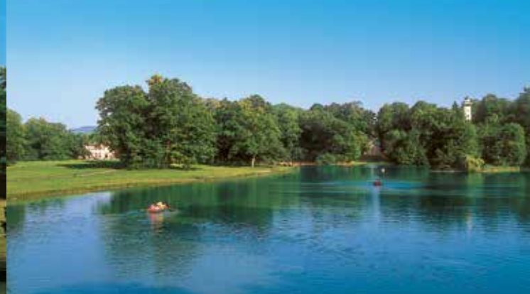
Blick von der »Roten Brücke« auf den Unteren See

und Dörfchen, Speisesaal und Wirtschaftsgebäude sowie die künstlich aufgeschütteten »Berge« mit Aussichtsturm und Teufelsbrücke. Das klassizistische Gartenschloss, erbaut 1778 bis 1782 nach Plänen des Architekten Emanuel Joseph von Herigoyen, ist durch eine Blickachse mit dem Stadtschloss Johannisburg verbunden. Seine mit Mobiliar im Stil Louis-seize eingerichteten zehn Schauräume bieten ein anschauliches Beispiel fürstlicher Wohnkultur am Ende des 18. Jahrhunderts. Im Küchenbau des Parks befindet sich ein Besucherzentrum, das an den Wochenenden und an Feiertagen von April bis September geöffnet ist. Hier kann der Spaziergänger sich in einer Ausstellung über die facettenreiche Geschichte dieses bedeutenden Landschaftsgartens informieren. In dem dazugehörigen kleinen Blumengarten sind liebevoll gepflegte Blumenzpflanzungen zu sehen.