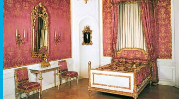
Schlafzimmer in den fürstlichen Wohnräumen

Bayerischer Staatsminister der Finanzen, für Landesentwicklung und Heimat