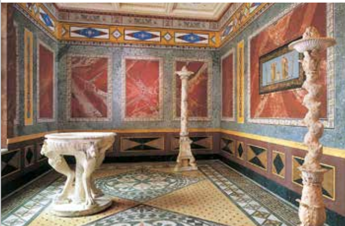
Sommertriclinium (Speisezimmer) mit Stuckmarmor

Am Hochufer des Mains steht im Schlossgarten das Pompejanum. Angeregt durch die Ausgrabungen in Pompeji ließ König Ludwig I. diese ideale Nachbildung eines römischen Wohnhauses von 1840 bis 1848 durch den Architekten Friedrich von Gärtner errichten – nicht als Villa für sich selbst, sondern als Anschauungsobjekt, das den Kunstliebhabern auch hierzulande das Studium der antiken Kultur ermöglichen sollte. Um zwei Innenhöfe, das Atrium mit seinem Wasserbecken und das begrünte Viridarium im rückwärtigen Hausteil, sind im Erdgeschoss die Empfangs- und Gästezimmer, die Küche und die Speisezimmer angeordnet. Für die prachtvolle Ausmalung der Innenräume und die Mosaikfußböden wurden antike Vorbilder kopiert oder nachempfunden.