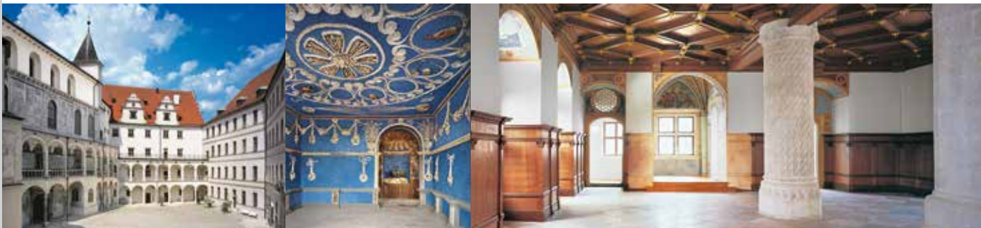
Nymphenburger Porzellantasse mit Porträt der Herzogin Maria Amalia (o.); Rittersaal mit prachtvoller Kassettendecke (u.)

Das eindrucksvolle Panorama fürstlicher Geschichte entfaltet sich in den einstigen Wohn- und Staatsräumen der Pfalz-Neuburger Fürsten. Rund 550 Kunstwerke – Porträts und wertvolle Bildteppiche, Waffen, Möbel und kostbares Kunsthandwerk – veranschaulichen ein spannendes Kapitel pfalz-bayerischer Geschichte.