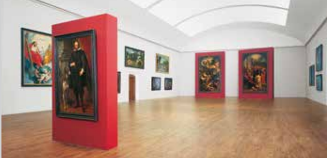
Großer Saal im Westflügel mit den Rubens-Altären