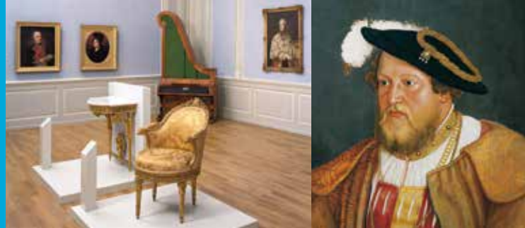
Pfalz-Neuburg-Museum (li.); Pfalzgraf Ottheinrich (re.)

Bayerischer Staatsminister der Finanzen, für Landesentwicklung und Heimat