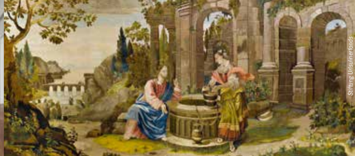
»Jesus und die Samariterin«, Altar-Antependium in Nadelmalerei